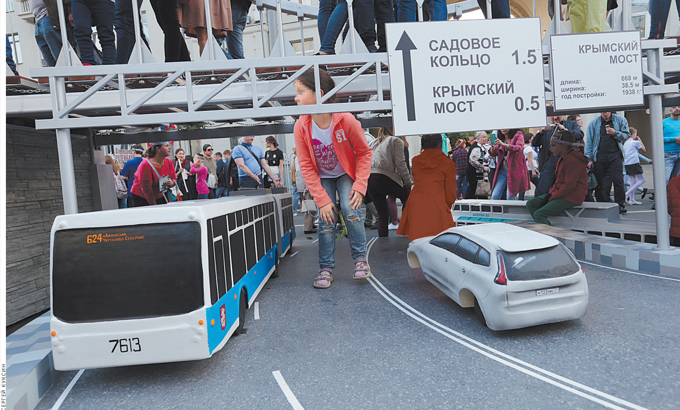
Главное не стоимость поездки, а безопасность детей.

не оформлять такие перевозки как детские. Конечно, просто заказать автобус — это гораздо дешевле и не требует хлопот по оформлению перевозки. Но речь идет о безопасности детей, а тут ни время, ни деньги считать не стоит. Поэтому стоит еще раз пояснить, что, если в автобусе будет перевозиться более восьми детей, это организованная перевозка детей, которая требует соответствующего оформления. Даже если у сопровождающего или сопровождающих есть доверенность от других родителей. А если дети едут в сопровождении родителей или их законных представителей — опекунов или попечителей, это не считается организованной перевозкой детей. Конечно, это относится к многодетным семьям. Материал подготовлен в рамках реализации федерального проекта «Безопасность дорожного движения» национального проекта «Безопасные и качественные автомобильные дороги».