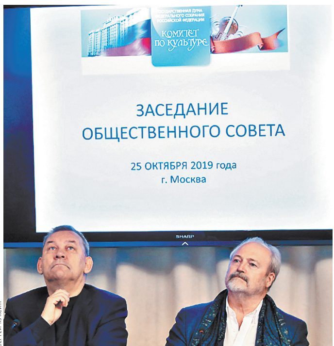
А режиссер Владимир Хотиненко (справа) предложил сделать упор на экранизации книг.