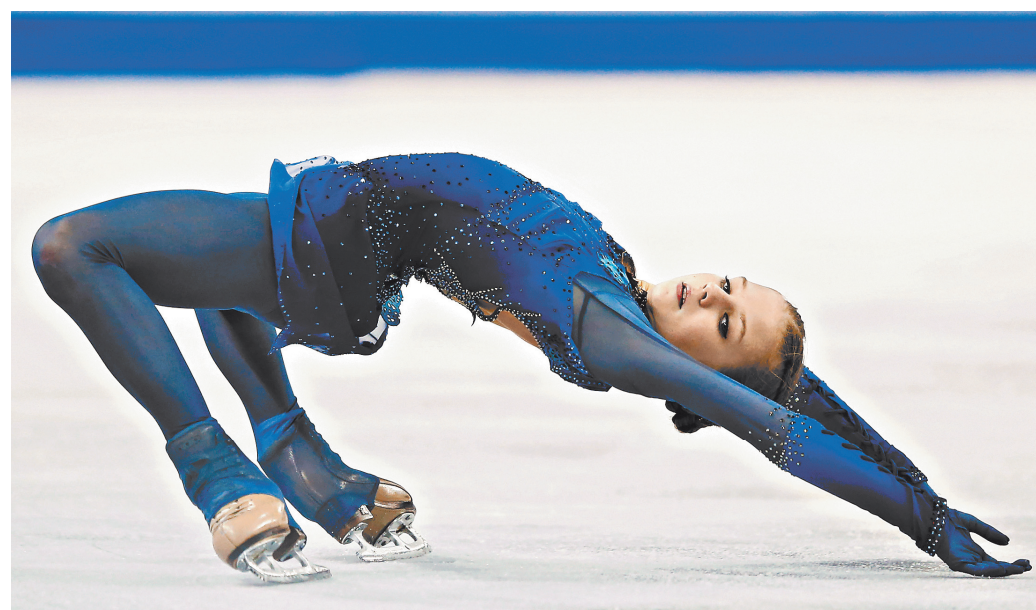
С таким набором сложнейших элементов Александра Трусова вне конкуренции.

Гран-при в Канаде крайне неудачно сложился для двукратной чемпионки мира, серебряной медалистки Олимпиады Евгении Медведевой, которая ушла от Тутберидзе к канадскому специалисту Брайану Орсеру. В короткой программе Женя упала с тройного тулупа.