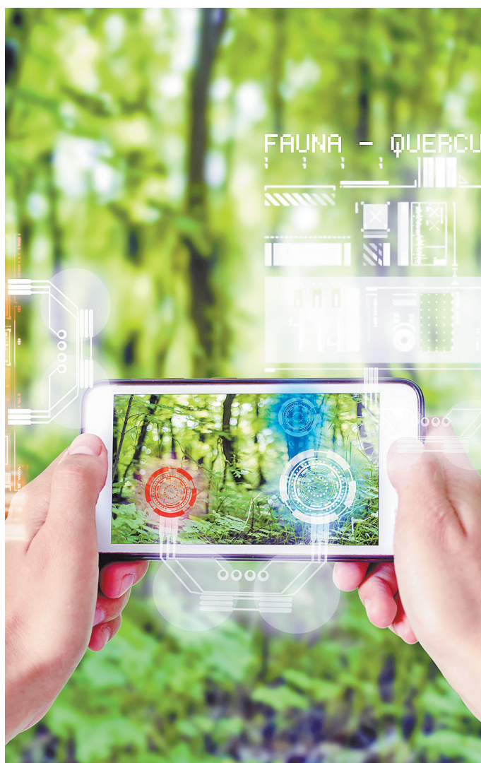
Беспроводные датчики передадут данные экологам в режиме онлайн.