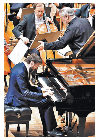
Даниил Трифонов дал два концерта в Мариинском театре.

В оркестровой программе прозвучали три сюиты из русских опер и балетов: «Сказание о невидимом граде Китеже и девице Февронии» Римского-Корсакова, «Жар-птица» Стравинского, «Золушка» Прокофьева. Среди самых неожиданных интерпретаций Гергиева — прокофьевская «Золушка», имеющая мало общего со сказочной историей. «Золушка» в гергиевской версии — тревожная, расправаемая изнутри колоссальной энергией несущегося вперед движения, безостановочного, как пульс времени. Исполненная в концерте сборная сюита из 14 номеров как раз открывалась Сценой с часами, где раскаты меди и жесткие удары литавр отсчитывали время какого-то апокалиптического бала с его беспокойными мазурками и вальсами. Противовесом этой вздыбленной и темной фактуре у Гергиева звучали вариации и сцены