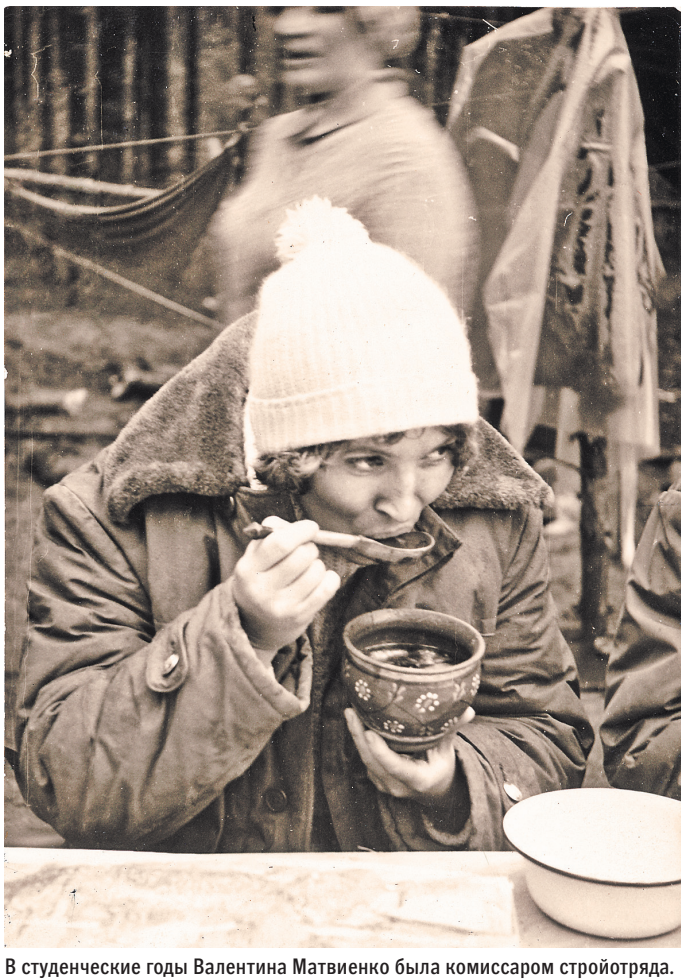
В студенческие годы Валентина Матвиенко была комиссаром стройотряда.

В ряде стран ЕС Booking.com после антимонопольных дел отказался от гарантии лучшей цены