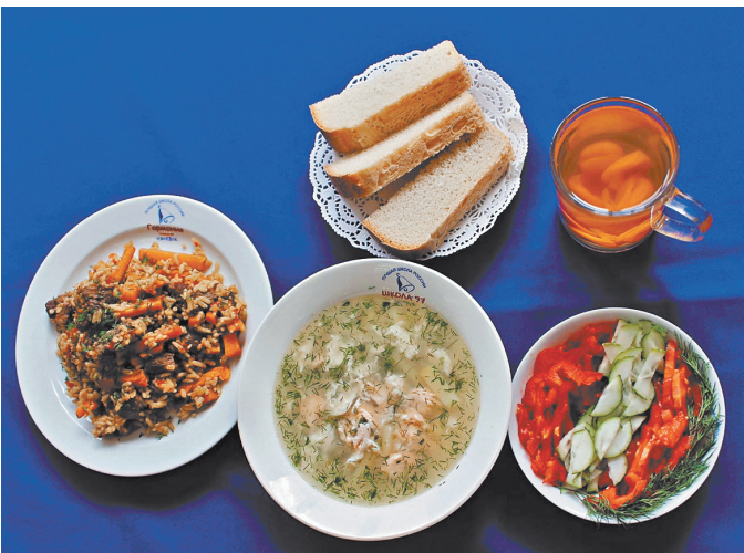
Было разработано специальное мобильное приложение, через которое ученик сможет заранее сформировать и заказать свое меню.

Если в школе такое меню, ученики от обедов не отказываются. Школ, где хорошо и вкусно кормят, становится все больше. 97-я — одна из них.