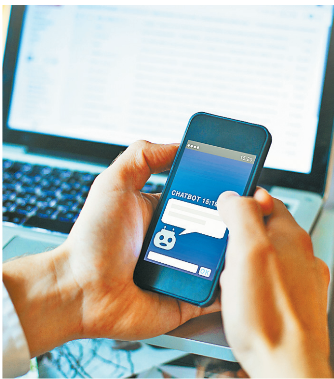
Чаще всего с чат-ботами приходится сталкиваться клиентам банков.

ПОТРЕБИТЕЛИ ГОТОВЫ ОБЩАТЬСЯ С КОМПАНИЯМИ ЧЕРЕЗ ЧАТ-БОТОВ