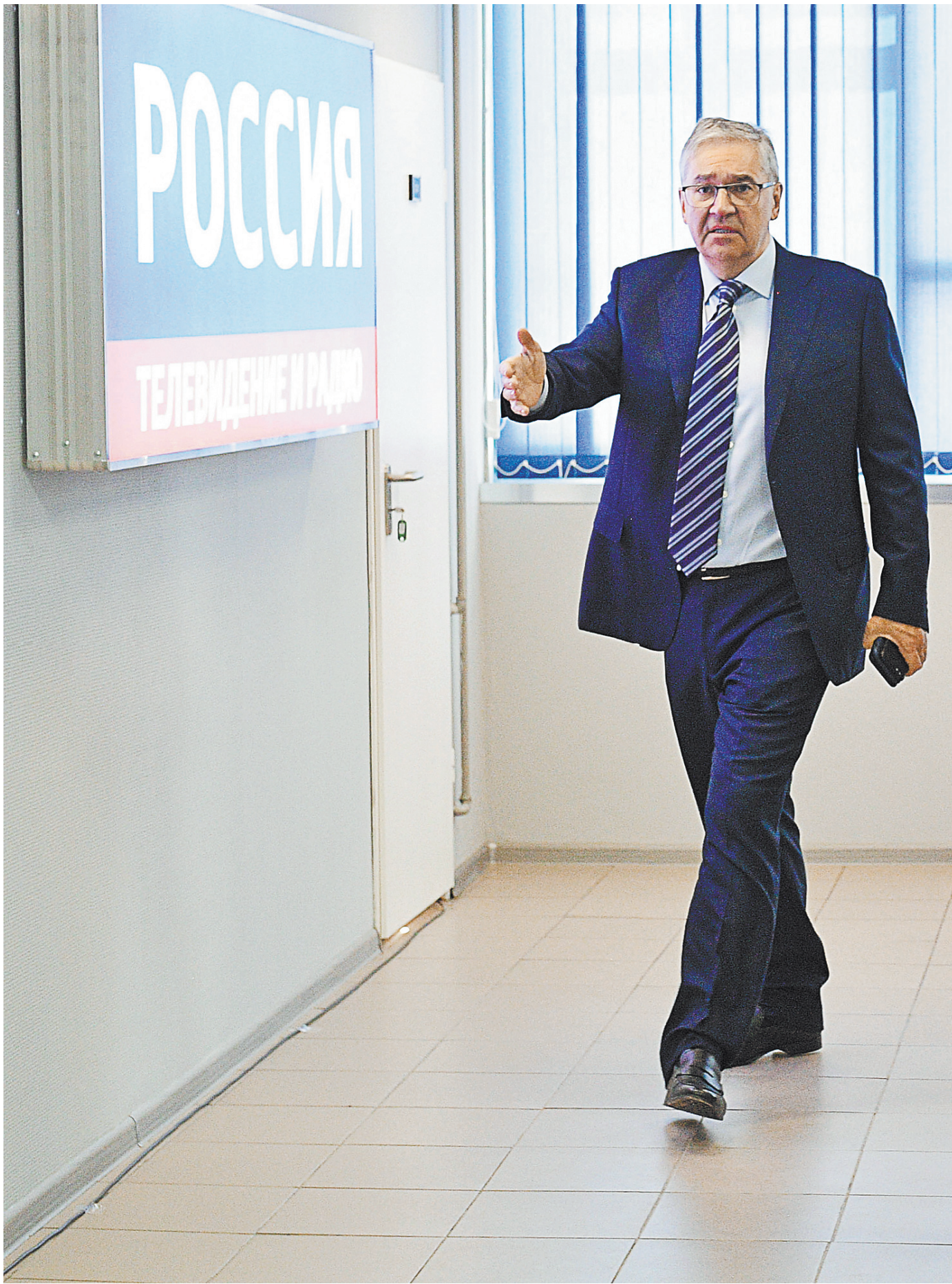
Почти 20 лет Олег Добродеев возглавляет ВГТРК, а это — целая империя.