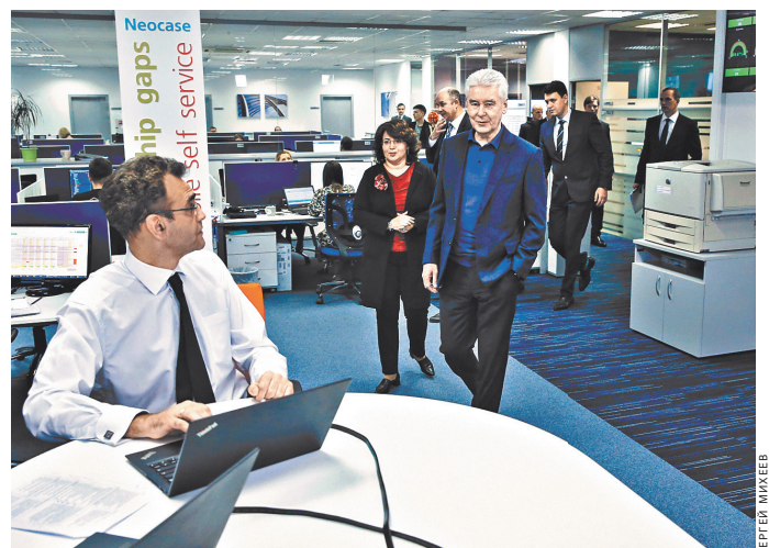
Мэр Москвы Сергей Собянин побывал в технопарке российского холдинга, подарившего столице множество инновационных разработок.

В IT-сфере занят каждый десятый москвич, а количество вакансий в отрасли лишь за год увеличилось на 25%. «IT-отрасль с каждым годом набирает обороты. Ее значение в жизни города растет. В этом году объем отрасли составит около 4 триллионов рублей. Это космические цифры», — сказал мэр Москвы Сергей Собянин, побывав в технопарке. В прошлом году выручка московских IT-компаний увеличилась на 7,4% по сравнению с годом ранее. Она составила 3,8 триллиона рублей — это, между прочим, 70% от суммарной по всей стране. В этом году рост, как ожидается, составит 7,5%. По словам мэра, город и дальше будет поддерживать технопарки. Такие кластеры получают пре-