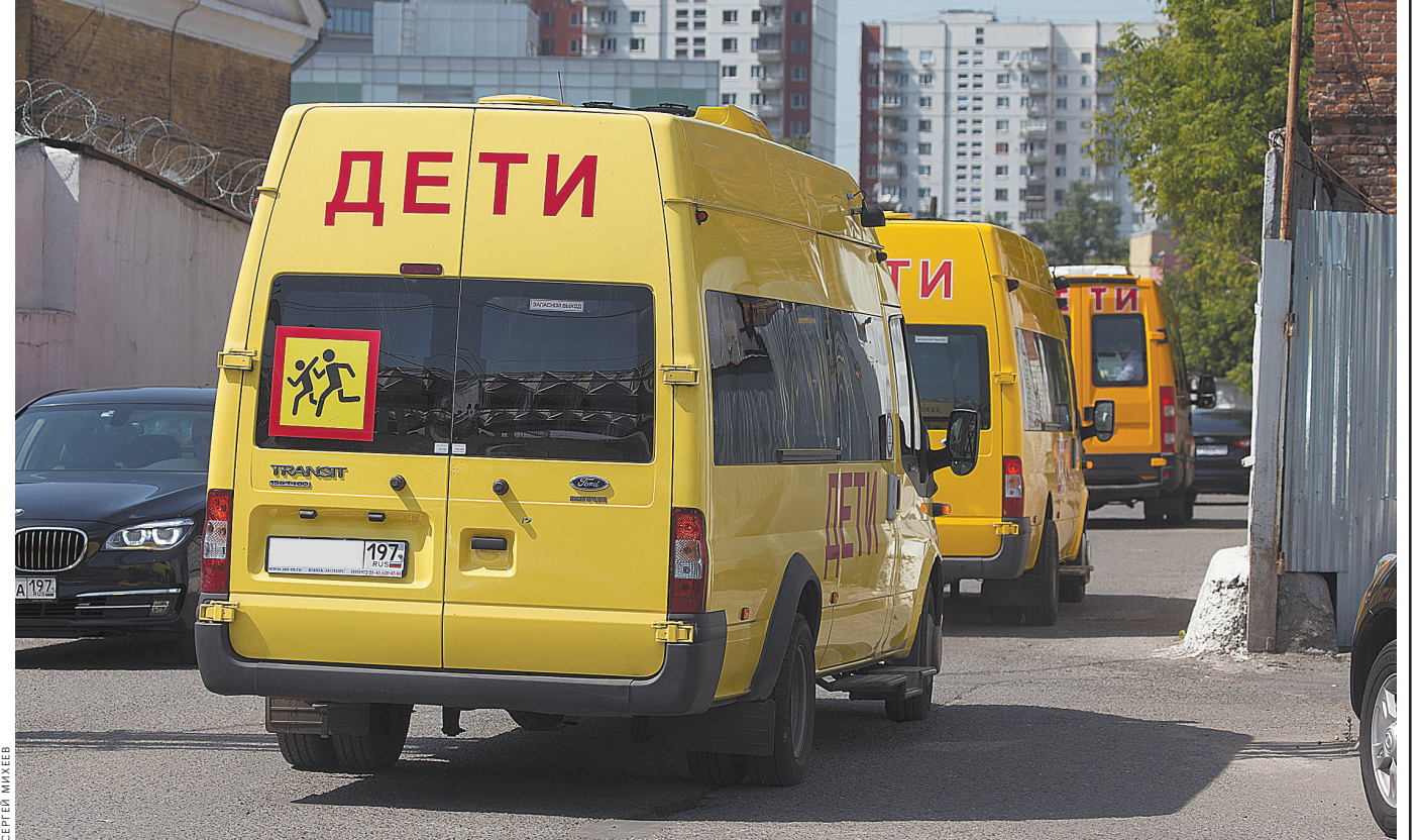
Три и более автобусов должны двигаться с сопровождением ГИБДД.