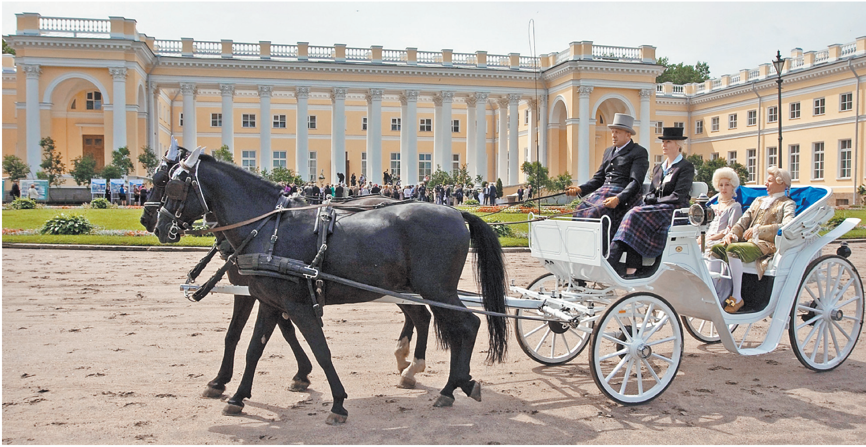
Завершается реставрация личных покоев императора Николая II и его супруги Александры Федоровны в Александровском дворце Царского Села, который стал последним домом царской семьи: отсюда они под конвоем были отправлены в последнее в своей жизни путешествие. Летом будущего года для посетителей откроют приемную, рабочий кабинет, мавританскую уборную и камердинерскую, а также палисандровую гостиную, свитскую и спальню. Окончательное завершение работ запланировано на 2022 год.