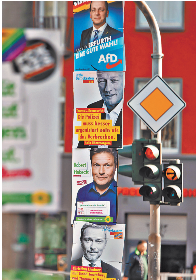
«Альтернатива для Германии» заметно укрепилась в Тюрингии за последние пять лет, а партия Ангелы Меркель, ХДС, наоборот, растеряла позиции.

раздающий прохаживая листовки «Левых». На прошлых выборах посткоммунисты впервые возглавили земельное правительство. После того, как «АдГ» стала недавно второй политической силой в двух других землях — в Саксонии и Бранденбурге, в Берлине предприняли последнюю попытку отвоевать избирателей.