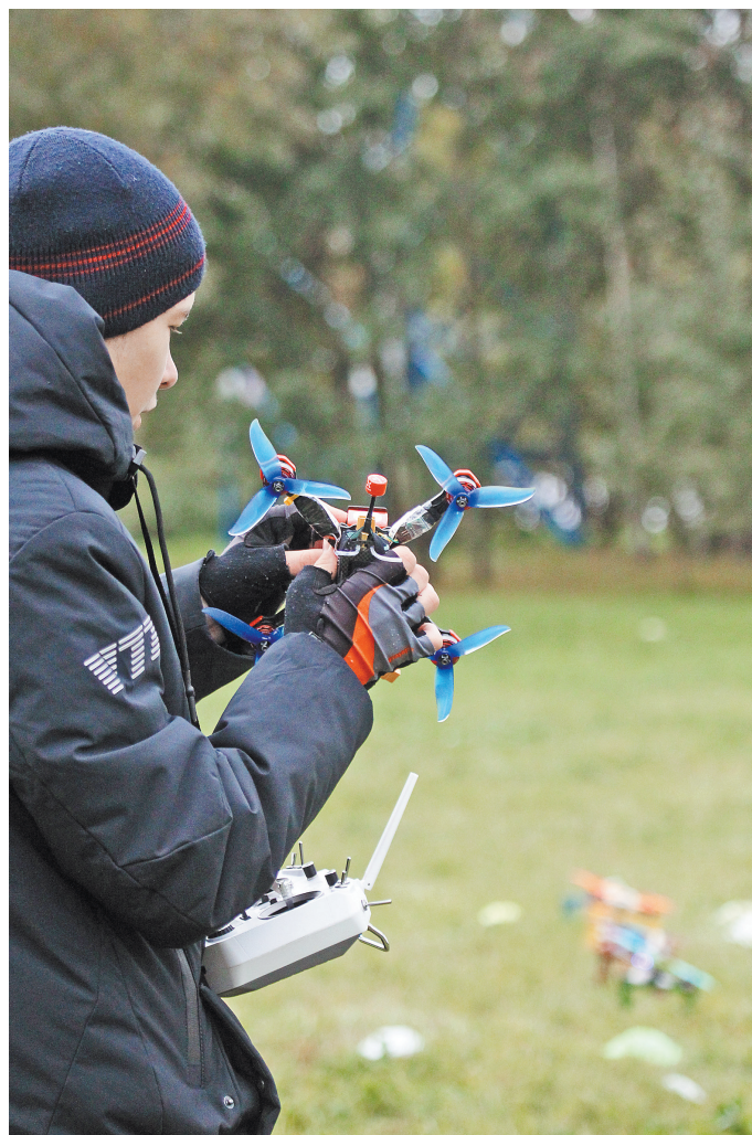
Новая технология позволяет сажать неопознанный дрон в точку его старта.