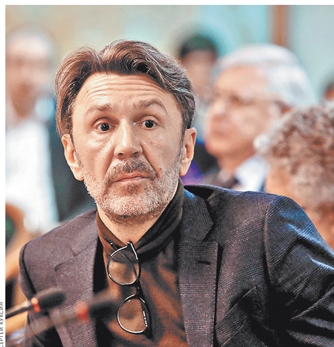
Музыкант Сергей Шнуров уверен: Дети должны именно сами осознать, зачем им нужно читать.