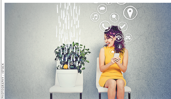
Через смартфон можно полить цветы или сварить кофе к приходу домой.

Роутер — виртуальная дверь в ваш дом Почти все знают, зачем нужен роутер: он объединяет все устройства в квартире в локальную сеть и обеспечивает доступ к интернету. При этом мало кто заботится о его безопасности. Между тем