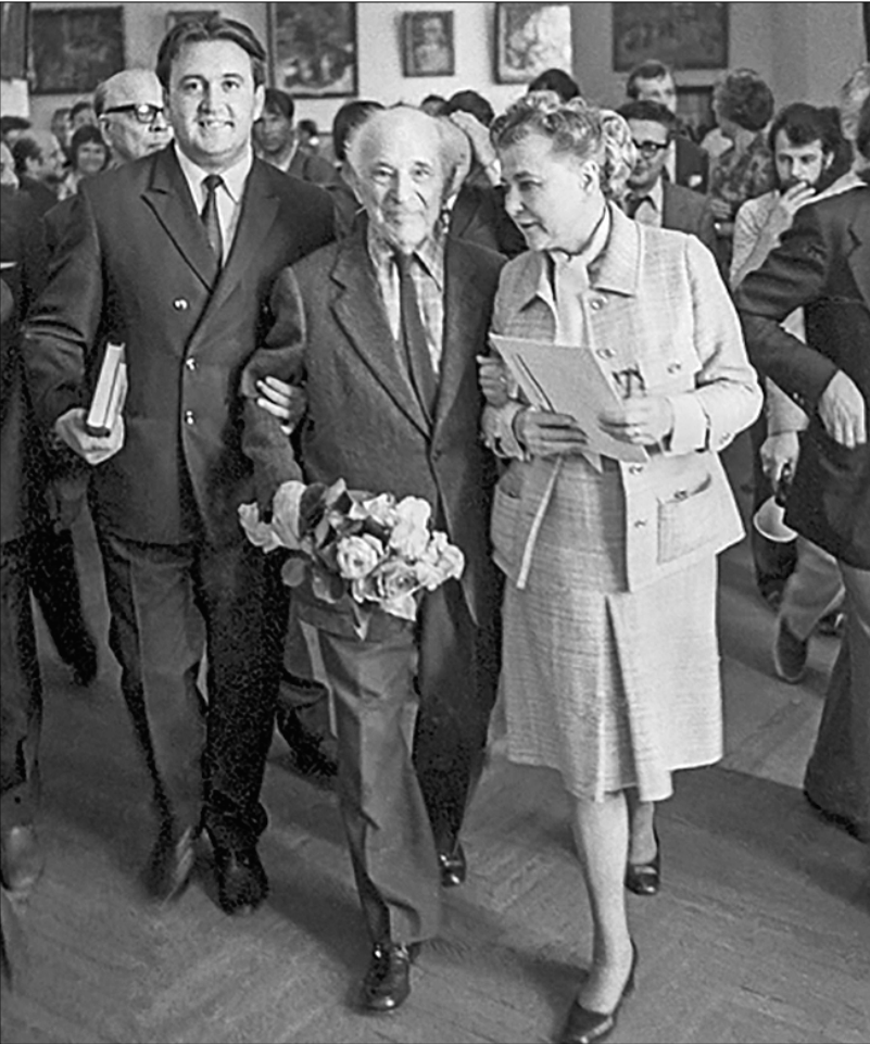
□ Рабочий момент.

менитого Шагала. В Советской стране побывали картины мастеров импрессионизма и легендарная «Мона Лиза» кисти Леонардо да Винчи. Не остались без впечатлений и меломаны: в 60-х им поспособствовали услышать живой голос Иаа Монтана и оркестровую музыку Бенни Гудмена. А в 1974 году произошла на-