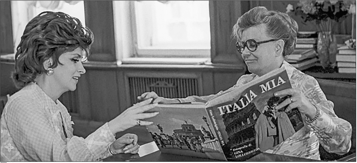
□ С Джинной Лоллобриджидой.